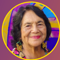
Dolores Huerta Activista de Derechos Humanos Fundación de Dolores Huerta